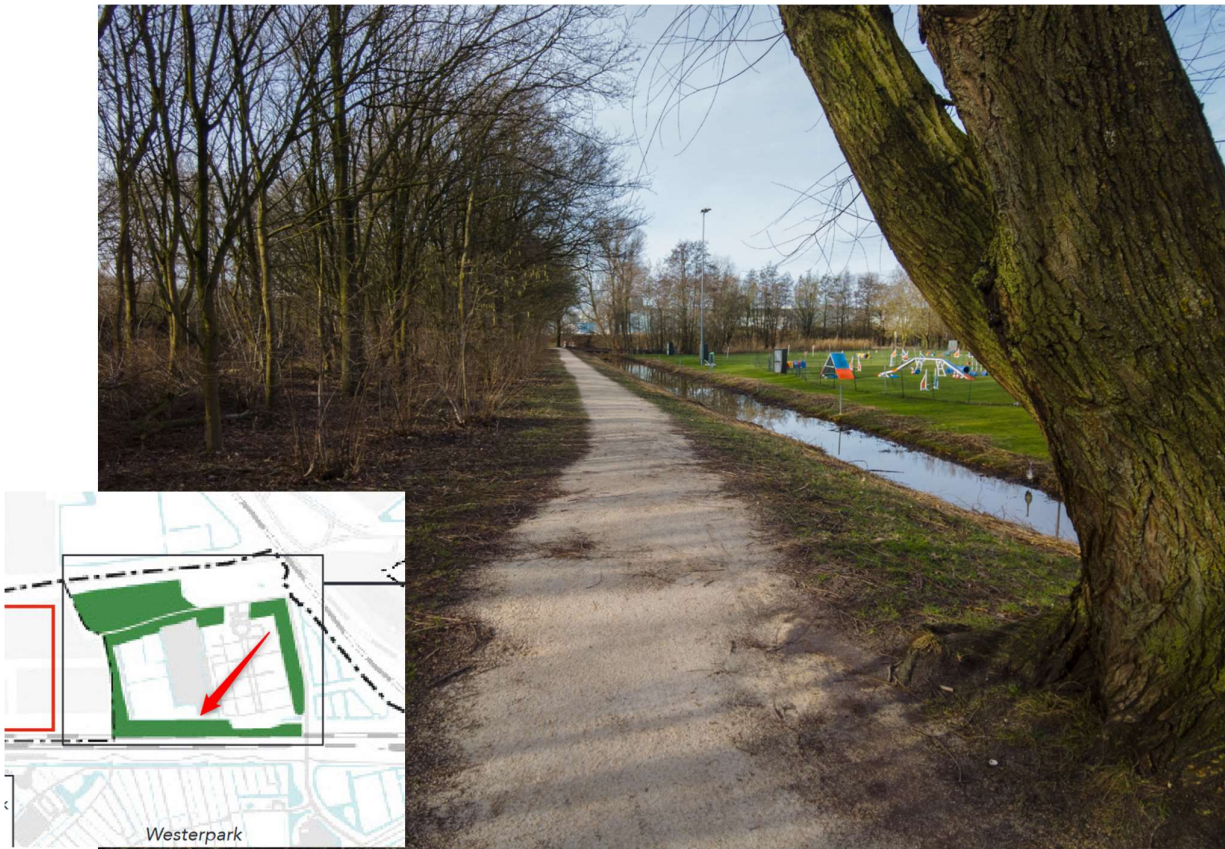
Langs het spoor: hoezo niet publiek toegankelijk?