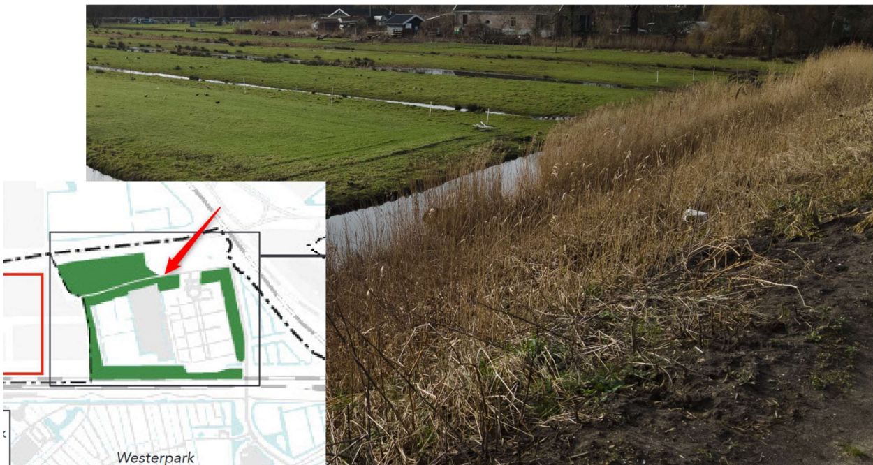
Talud bij St. Barbara: steil aflopend