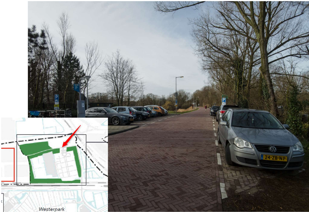
St. Barbara: hoezo niet publiek toegankelijk? Aan weerszijden van de brede weg een klein aflopend talud.